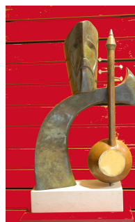
© Sculpture de Toros - Centre du Patrimoine Arménien

Ouvertures thématiques HISTOIRE - RELIGIONS - MINORITÉS La Première Guerre mondiale Borne interactive sur l'Empire ottoman