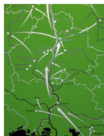
© Jean-luc Huard - Centre du Patrimoine Arménien

Ouvertures thématiques MIGRATIONS - NATIONALITÉ L'après-guerre en France